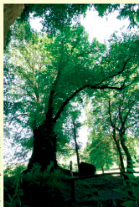
Guy Frenant

L'Orme du Trou de Faule est l'un des deux seuls survivants de l'inventaire photographique de 1900 qui ne soit ni un tilleul ni un chêne.